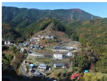
極楽橋が近づくと、このような風景も。大阪から1時間少々とは思えない山深い地域を走ります。