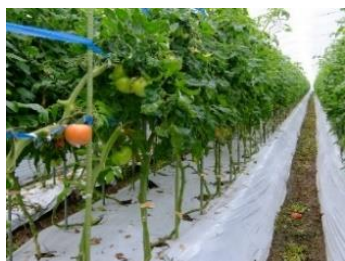
トマトのハウス栽培の様子 (熊本県八代市)

（変わらなければすいません）、思わず手に取ってしまうかもしれません。ということで、今回は野菜の王様、「トマト」に関して紹介したいと思います。