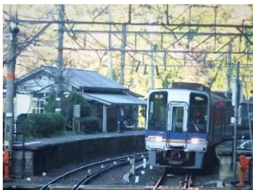
山深い地域を走る高野下から極楽橋の区間。途中の駅で対向列車とすれ違います。小さな駅でも駅員さんが直立不動で列車の到着を見守っています。