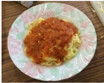
学生と作ったトマトパスタ。 パスタも手作りで作りました。

余ったトマトを使って、時々、トマトパスタを作っていました。湯むきしたトマトを鍋に入れて焦げ付かないようにどろっとするまで煮詰めます。その煮詰めたトマトを炒めた玉ねぎとニンニクに入れて塩コショウで味付けして、ゆでたパスタにあえる、というだけのものです。トマトから出る水分だけで作るので濃厚な味になります。調理用にする場合は、あまり甘いトマトを使うと甘すぎるソースになるので、その場合は、レモン汁など酸味のあるもので味を調整するのが良いと思います。特別感を出すためにパスタはパスタマシンを使って手打ちで作ったりすると、みんなでワイワイ共同作業になり、おいしさも倍増ですね。たくさん作っておいて、翌日にベーコンやミンチ肉、野菜などを入れて味を変えて楽しんだりするのも楽しみの一つです。食のイベントを通して、研究室の輪がぐっと縮まるのを実感できる瞬間です（早くコロナが収まってほしいなあ...）。