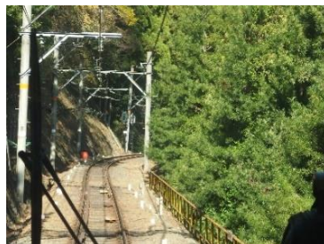
列車の前方を眺める。急なカーブと坂で高野山へ向かいます。速度は時速30km程度しか出ません。