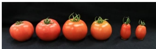
色々なトマト。左2つは日本の品種、真ん中2つはオランダの品種、右2つはミニトマト。オランダの品種は収量がものすごく多く、皮がオレンジ色なのが特徴。ミニトマトは普通のトマトより糖度が高くなりやすい。

料理を作る際に知らず知らず意識しているのが、甘味、塩味、酸味、苦味、うま味の5つの基本味ですね。トマトを食べるときも、甘味、酸味などを感じる人が多いと思いますが、野菜の中でもトマトはうま味成分がとても多いことが知られています。トマトのうまみ成分はアミノ酸の一種のグルタミン酸です。トマト以外にもグルタミン酸が含まれているものがありますが、トマトは一般的な野菜の中ではかなりの高含量になります。日本人は、昆布だしが好きですが、そのうまみ成分がまさにグルタミン酸です。海外、特に西洋では、昆布を利用するところはそれほど多くはありませんが、そういった国々でトマトを料理するのは知らず知らずの間にうまみ成分を補っているのかもしれない。また、調理する際に加える肉類などに含まれるうまみ成分のイノシン酸との相乗効果でうまみを強く感じることもできます。