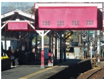
真田幸村ゆかりの九度山駅。ホームの屋根にも六文銭が見えます。

ここからはケーブルカーと路線バスを乗り継ぎ、金剛峯寺や奥之院（弘法大師御廟）がある高野町の中心部へ着きます。まずは奥之院にお参りするために、「一の橋口」という停留所でバスを降り、うっそうと木々が茂る参道を歩きます。この2km程度の参道の左右には無数のお墓があり、有名な戦国武将（例えば織田信長や武田信玄）や多くの大名家の墓があり、歴史の教科書に出てくる面々も何となく身近に感じられます。荘厳な雰囲気は漂う奥之院に参拝した後は、バスターミナルがある中の橋へ向かう参道を歩きますが、こちらは木々が無く明るい雰囲気です。この参道沿いにはお墓の他、有名企業の石碑や慰霊碑も多く鎮座しており、コーヒーカップ（缶コーヒーのメーカー）、ミニロケット（重工系の企業）、頭を下げる羽織袴の石像（足袋屋さん）など、奥之院とは違った世俗的な雰囲気が感じられ、この対比も面白いものです。今回は「壇上伽藍」をご案内します。