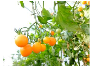
黄色いトマトで黄色いトマトソースを作ってみたけど、あまり黄色くならなかったのが残念。

ちなみにプランタ栽培の場合は、水やりの量や液肥の濃さを変えることで品質の調節ができます。トマトは乾燥気味にしたり、少し濃いめの液肥をあたえると糖度がのりやすくなります（もちろん極端はダメです）。プランタだと、それらの調節がしやすいのでいろいろと試してもらえばよいのではと思います。農業試験場の研究者の人でも、実験用のトマト以外は濃いめの液肥をかけている人もいます。トマトには様々な品種があります、トマトの味の違いはスーパーで果実を購入するとわかりにくいですが、品種ごとに食べ比べると意外と違いがあることがわかります。家庭での栽培では好みの品種を作ったりできますので是非いろいろ試してもらえばと思います。